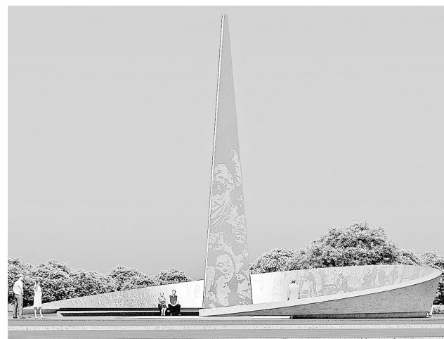
Такие стелы установят во всех 20 городах трудовой доблести, однако художественное оформление пилона и барельефа у каждого будет особым

С порядком регистрации претендента, подачи заявок и внесения задатка можно ознакомиться в разделе «Инструкции по работе в торговой секции «Приватизация, аренда и продажа прав» по ссылке: http://utp.sberbank-ast.ru/AP/Notice/652/Instructions.